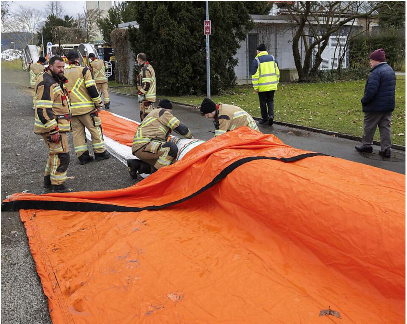
Angehörige der Arboner Feuerwehr demonstrieren die Funktionsweise des Systems