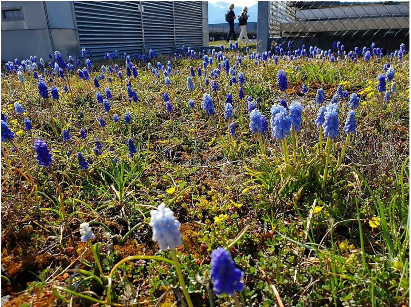
Beispiel einer Dachbegrünung

Eine Dachbegrünung unterstützt die Biodiversität in Siedlungsräumen. Gerade dort haben zusammenhängende Grünflächen einen besonders hohen Stellenwert. Oft werden sie durch Baukörper zerschnitten. Eine Dachbegrünung ermöglicht die räumliche Verbindung zwischen solchen Grünräumen. Auch eine Dachbegrünung mit einer PV-Anlage ist gut umsetzbar.