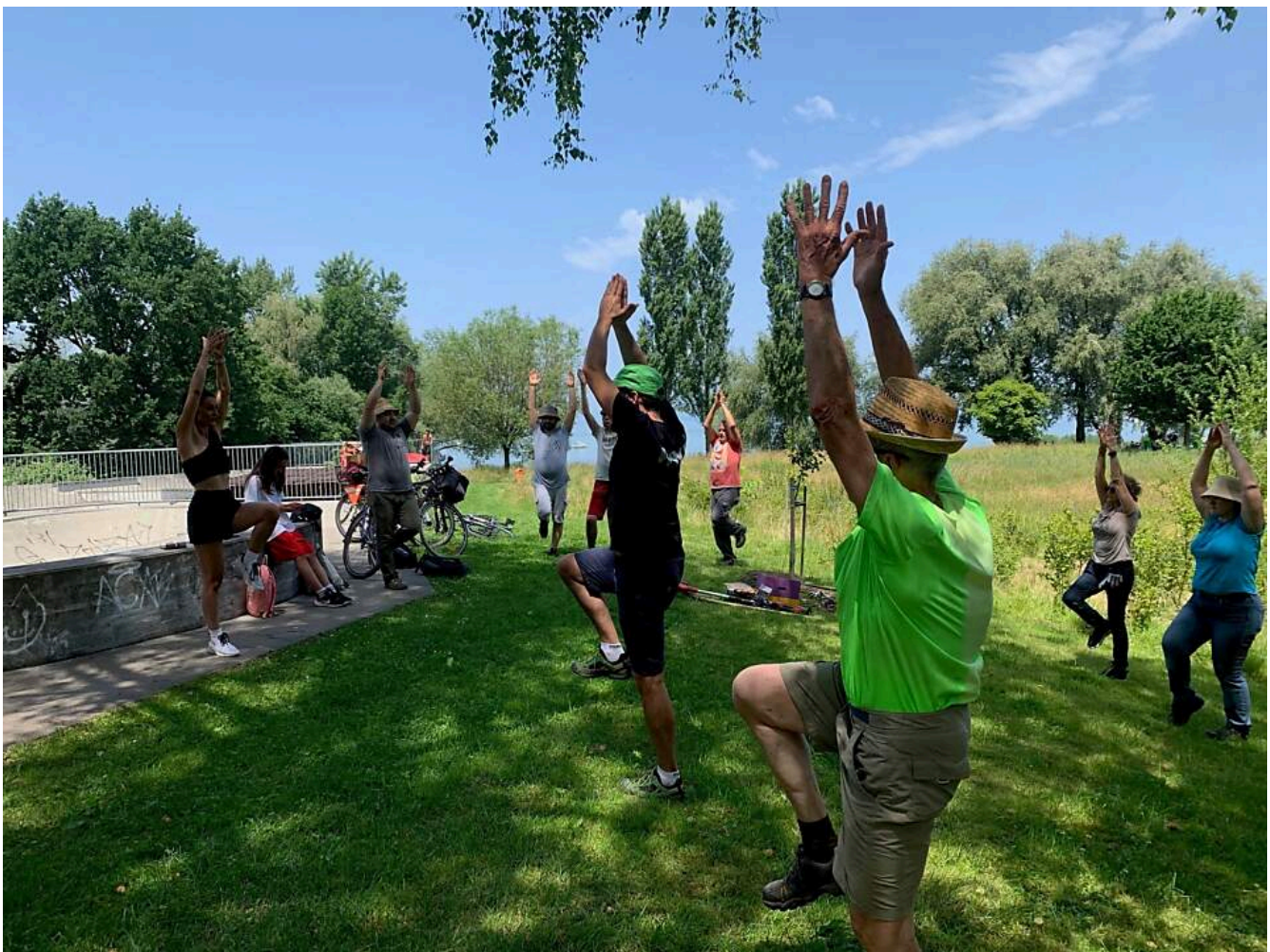
Aufwärmübungen unter Anleitung der FitBox beim ersten Greengym-Anlass in Arbon am 14. Juni 2025

Der erste Greengym-Anlass in Arbon fand am 14. Juni 2025 in Zusammenarbeit mit dem Natur- und Vogelschutz Verein "Meise" und der FitBox statt. Gemeinsam haben 14 Teilnehmende die Hecke beim Skatepark gepflegt und gleichzeitig etwas für die Fitness gemacht.